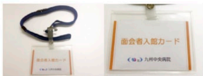
面会者入館カード

面会の方は、入院棟面会受付で受付していただきます。その際、入館カードをお渡ししますので、お帰りの際にご返却下さい。