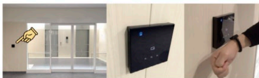
ICタグ認証リーダー端末（自動ドアが開錠します）

病棟に入室するには、入院棟1階のエレベーターホール入口又は2病棟入口の自動ドア横のICリーダーに、リストバンドやカードをかざして入室して下さい。