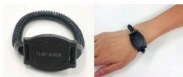
入院患者用入館リストバンド

入院される方は、入院時に入館リストバンドをお渡ししますので、病棟から出られる際は必ず腕に着用して下さい。退院時に返却していただきますので、紛失しないようにお気を付け下さい。なお、紛失された場合は1,100円（税込10%）をいただく場合がございます。