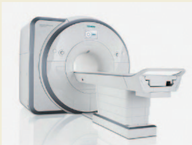
図2. 3.0T MRI装置 Skyra SIEMENS社製