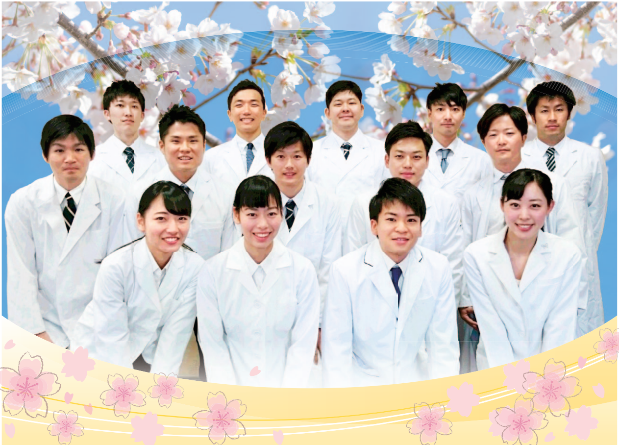
「平成31年4月採用臨床研修医」

〒815-8588 福岡市南区塩原三丁目23番1号 TEL 092-541-4936(代) FAX 092-541-4540